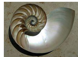
Logarithmische Spirale (Nautilus - Perlboote)