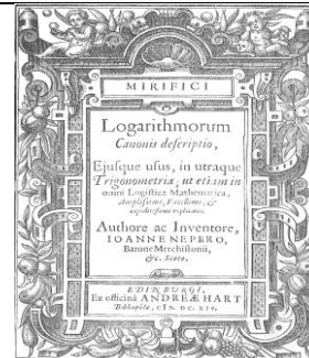
John Napier – Titelseite der ersten Logarithmentafel 1614